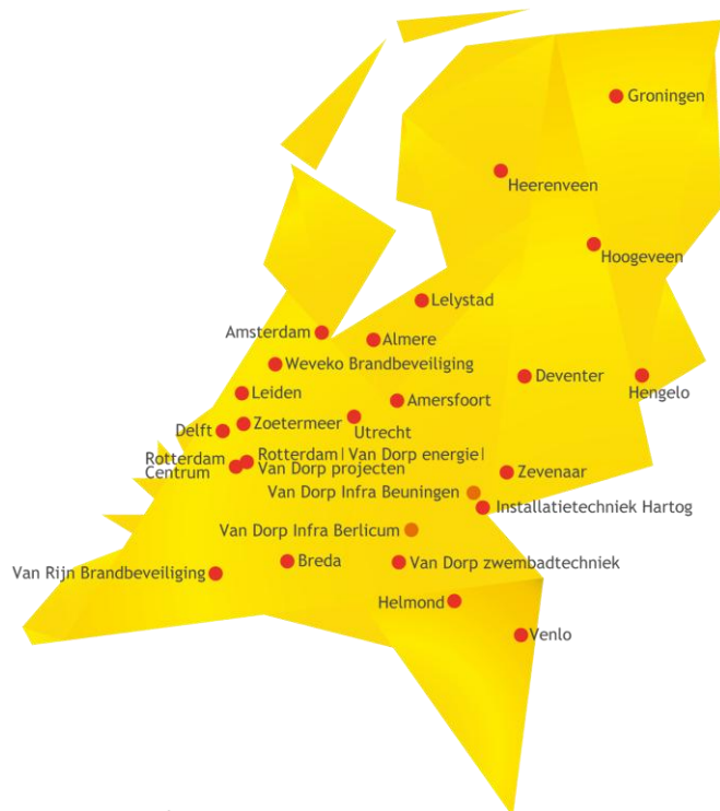
Figuur 1 Overzicht vestigingen Van Dorp

De bedrijfsactiviteiten van HG Industrial zijn ondergebracht bij onze nieuwe vestiging van Van Dorp – HGI, gevestigd aan de Columbusweg in Venlo. Het bedrijf en deze vestiging zijn sinds 2022 in de registraties en de systematiek van de CO 2 prestatieladder opgenomen.