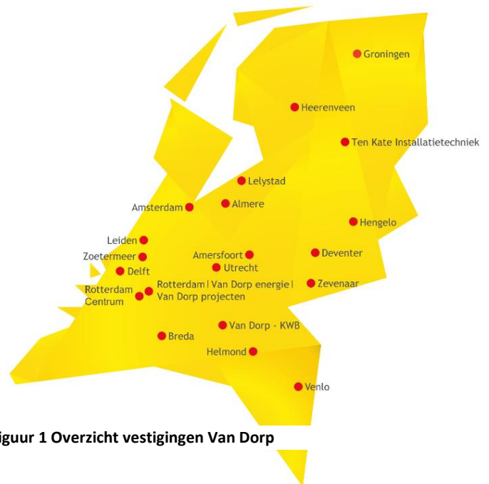
Figuur 1 Overzicht vestigingen Van Dorp

Vanaf 2021 is KWB in de CO 2 footprint rapportage van Van Dorp installatiebedrijven B.V. opgenomen.