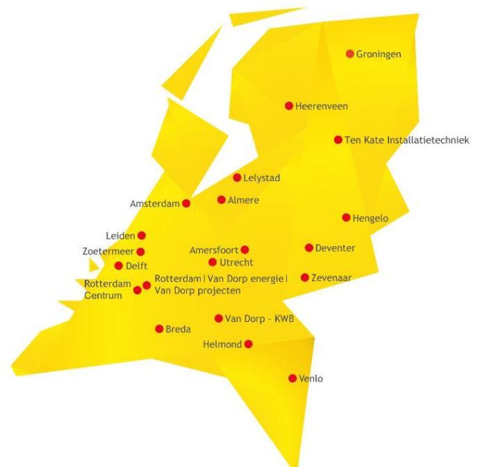
Figuur 1 Overzicht vestigingen Van Dorp

Op 16 december 2020 bereikte Van Dorp overeenstemming over de overname van Ten Kate installatietechniek in Hoogeveen. De integratie van Ten Kate installatietechniek zal in 2021 plaatsvinden en vanaf 2022 zal het bedrijf volledig in de CO 2 footprint van Van Dorp installatiebedrijven B.V. zijn opgenomen.