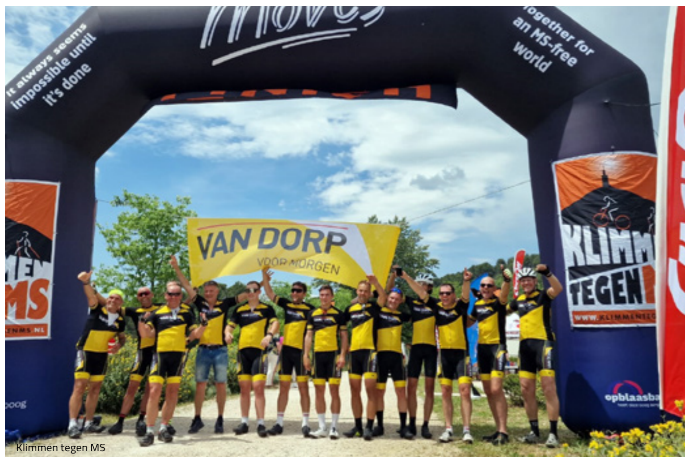
Klimmen tegen MS