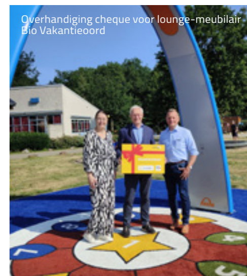
Overhandiging cheque voor lounge-meubilair Bio Vakantieoord

De Van Dorp foundation heeft een donatie van €8.800,- gedaan. Met deze donatie is een grote wens van veel gasten in vervulling gebracht: het toevoegen van lounge-meubilair aan de terrassen van de vakantiebungalows.