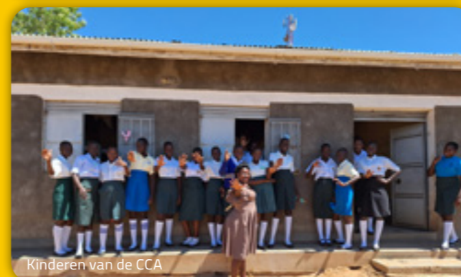
Kinderen van de CCA

Samen ondersteunen CCA en de Van Dorp foundation kwetsbare middelbare scholieren in de Karamoja regio met een jaarlijkse bijdrage van €10.000,-. De helft van dit bedrag wordt besteed aan een beter toekomstperspectief voor de kinderen door middel van onderwijs, gezondheidszorg, veiligheid en goede begeleiding van de kinderen. De andere helft zorgt ervoor dat gehandicapte kinderen geopereerd kunnen worden en medische zorg ontvangen.