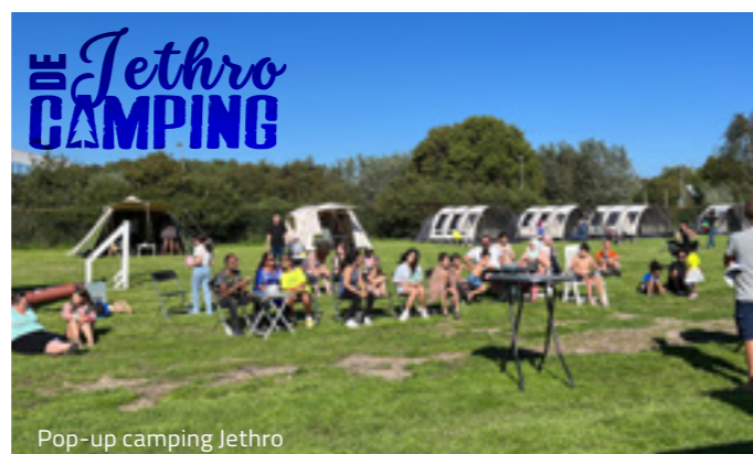
Pop-up camping Jethro