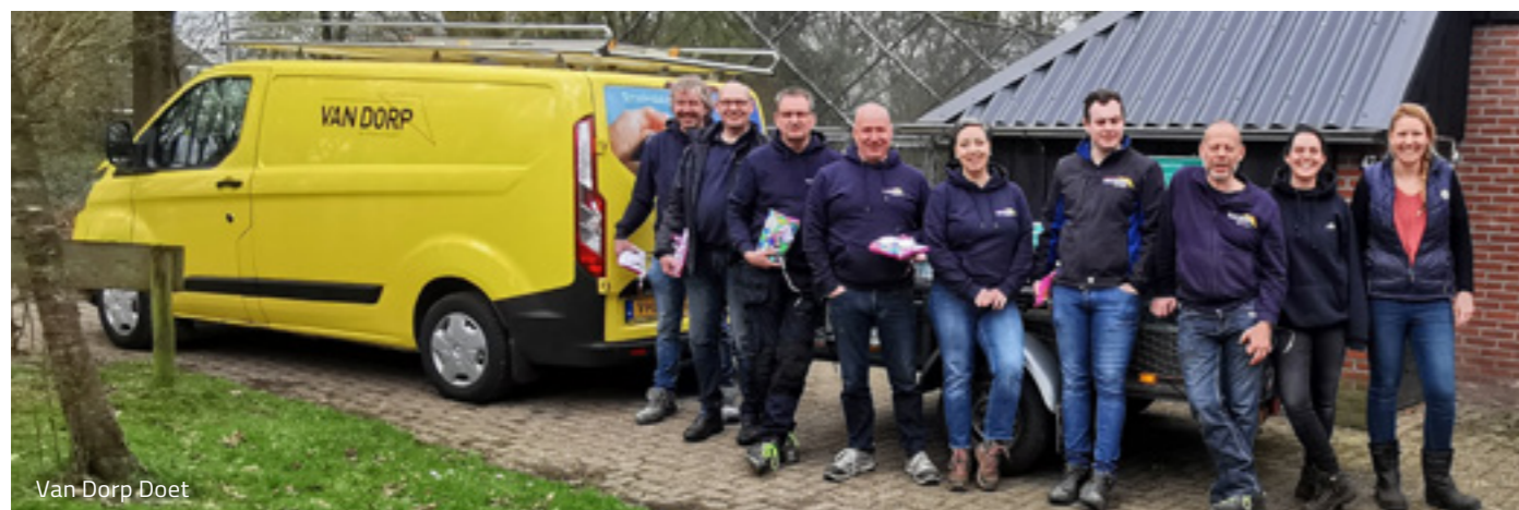
Van Dorp Doet

Van Dorp is een maatschappelijk betrokken groep van ondernemingen. De Van Dorp foundation kan zich, dankzij de inkomsten die zij voor een groot deel uit deze ondernemingen ontvangt, inzetten voor mensen die in minder kansrijke posities verkeren.