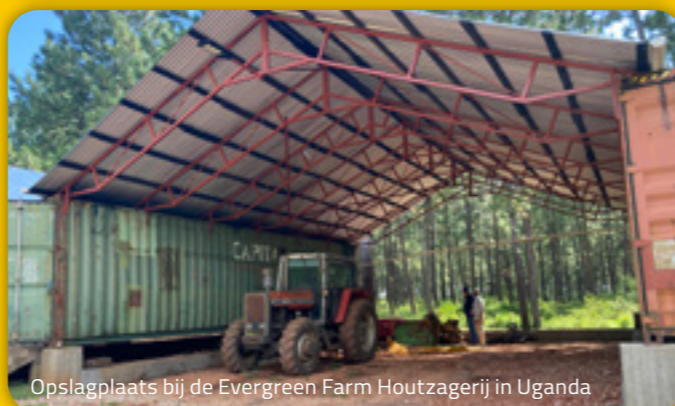
Opslagplaats bij de Evergreen Farm Houtzagerij in Uganda

Door het aanplanten van nieuwe bomen en het bevorderen van duurzaam bosbeheer, draagt de Evergreen Farm ook actief bij aan CO 2 -reductie. De bomen absorberen CO 2 uit de atmosfeer, wat helpt om de koolstofvoetafdruk te verkleinen en de impact van klimaatverandering te verminderen. Dit bos compenseert deels de CO 2 -uitstoot van de Van Dorp bedrijven in Nederland.