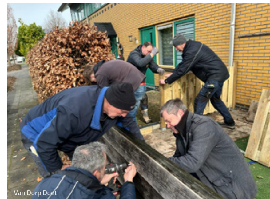
Van Dorp Doet

Tot slot willen wij aangeven dat we onze waarden van de Van Dorp foundation hoog in het vaandel hebben staan en deze graag willen uitdragen binnen de Van Dorp organisatie.