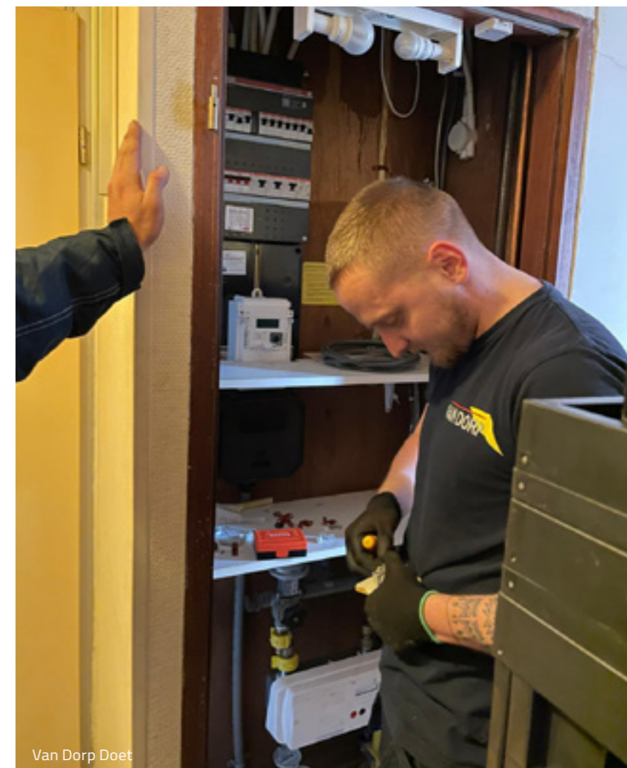
Van Dorp Doet