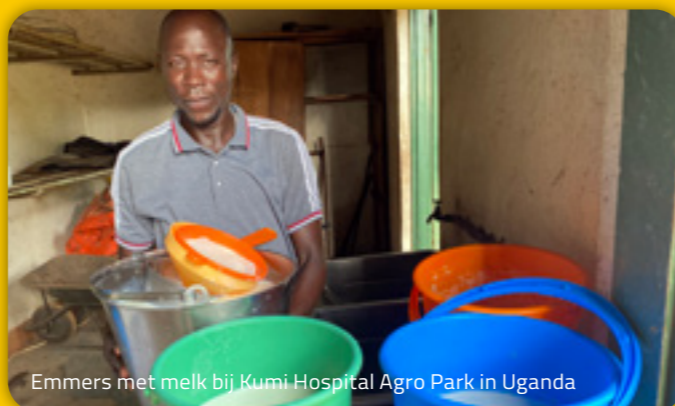
Emmers met melk bij Kumi Hospital Agro Park in Uganda