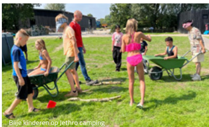
Blijde kinderen op Jethro camping