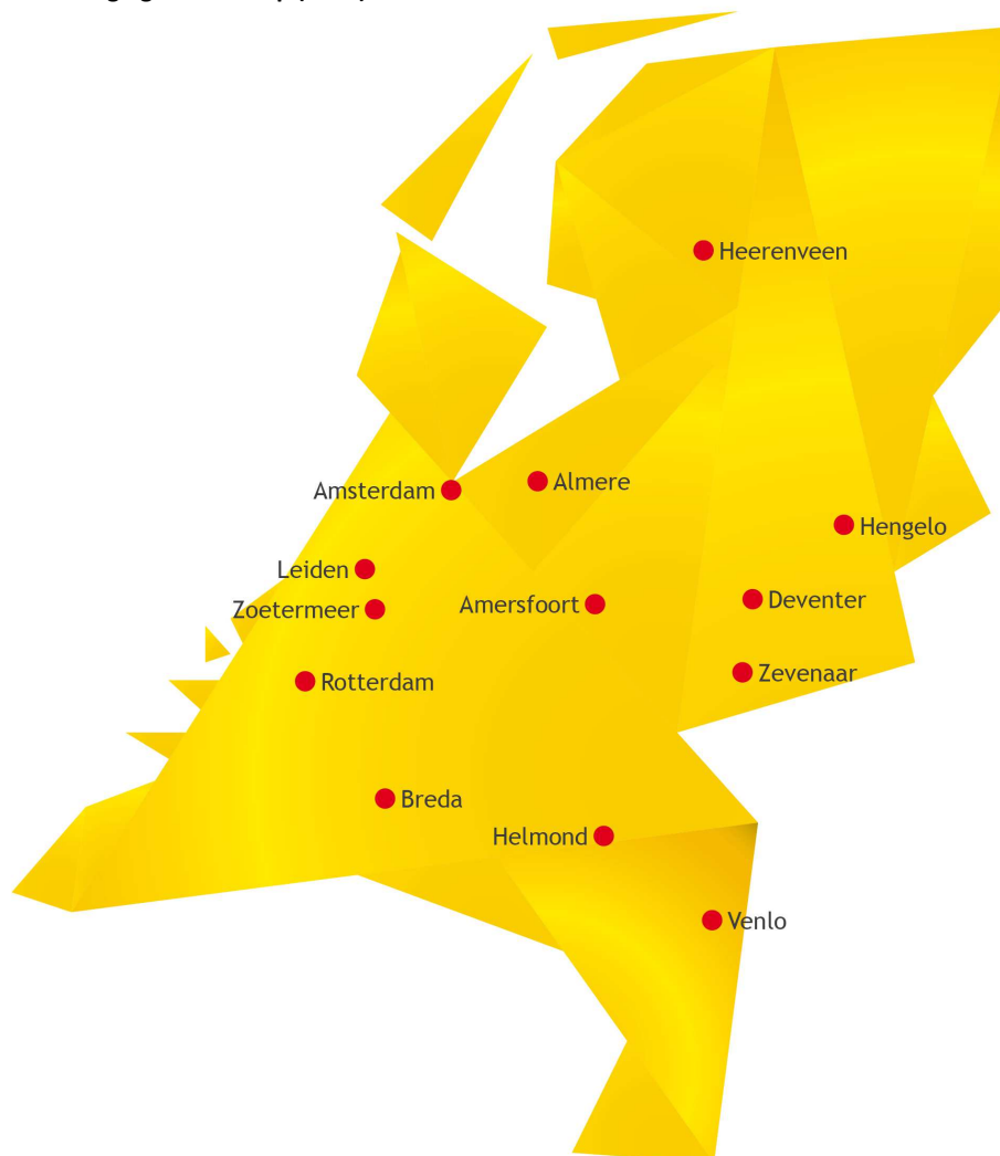
Figuur 1 Overzicht vestigingen Van Dorp (2016)

Op deze wijze houdt Van Dorp het overzicht over het totale installatiepakket en kan zo efficiënt inspelen op de wensen en behoeften van de klant. In de bedrijfsvoering is het kwaliteitsaspect van groot belang. Ook kennis en respect voor de klant, het product, de mensen en het milieu staan bij ons bedrijf hoog in het vaandel.