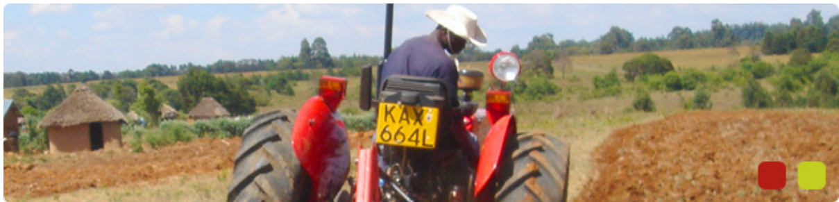
Een trekker voor de Stichting Christelijke Hulp in Kenia