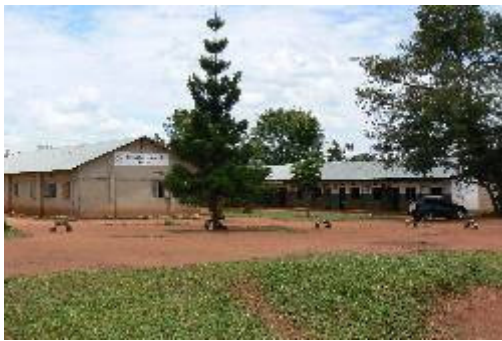
De Christian Kawukano School In Luwero, Uganda